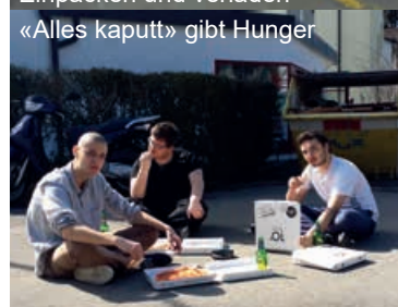
Der Auszug ist definitiv