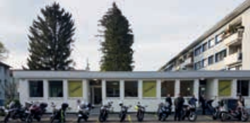
DO-Ausfahrten Tramstr. 109