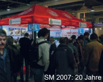
SM 2007: 20 Jahre