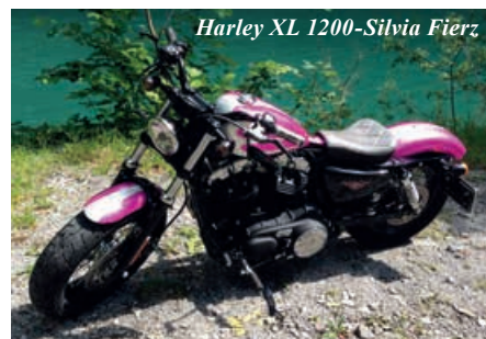
Harley XL 1200-Silvia Fierz

Einen anderen Trend sieht man bei den Enduros, ich spreche da von Maschinen, die zwar so aussehen, wie wenn man damit um die Welt fahren könnte, aber von den wenigsten so bewegt werden. Verschiedene Hersteller bieten Zubehör an, welches in unseren Breitengraden wenig Sinn macht, aber für eine Reise durch die Wüste wichtig ist. Was manche nicht bedenken, ist das Zusatzgewicht, welches durch unnötiges Zubehör generiert wird. Erst kämpft der Hersteller um jedes Gramm, das Maschinengewicht möglichst tief zu halten, damit der Kunde wieder unnütz aufrüsten kann. Die BMW R1200 GS ist ein gutes Beispiel dafür.