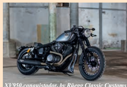
XV950, conquistador, by Rüegg Classic Customs

Years ago BMW made more turnover with accessories and clothing than with motorcycles. Meanwhile the GS is omnipresent. Production and sales figures have doubled in the last 10 years. And the sale of accessories is still booming!