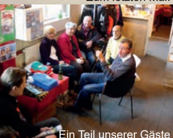
Ein Teil unserer Gäste