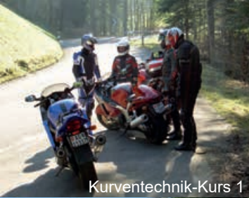
Kurvtechnik-Kurs 1 KT1: Flucht ins Gelände