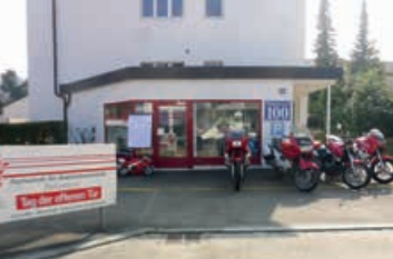
Zum letzten Mal!