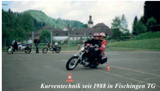
Kurventechnik seit 1988 in Fischingen TG