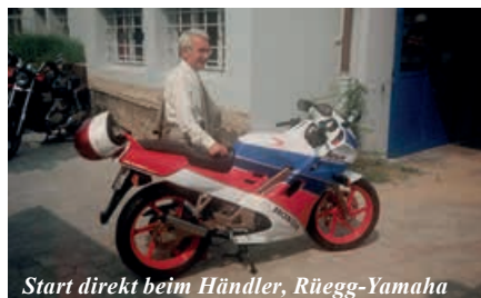
Start direkt beim Händler, Rüegg-Yamaha

Gleichzeitig (2007) äusserte ich mich zu den «geschenkten» Führerausweisen: Aus der Erlaubnis, 125 Kubik-Maschinen fahren zu dürfen, wurden über Nacht 25kW ohne Hubraumbeschränkung. Auch, dass 125er-Fahrer keine A1-Prüfung mehr ablegen müssen, stellte ich an den Pranger: Die kennen schon gar keine Regeln und verhalten sich entsprechend! Noch habe ich den Glauben nicht verloren, aber aus den 25 kW ohne Führerprüfung wurden inzwischen 35 kW, noch immer ohne Prüfung. Doch auch eine Neuerung mit Opera 3, wo solche «Fehler» korrigiert werden sollten, wird einen Passus der Besitzstandswahrung tragen, d.h. das neue Gesetz wird erst für künftige Geschwister gelten, alte profitieren von den grosszügigen Lösungen weiterhin. Und dies alles jenseits der Bemühungen um Verkehrssicherheit.