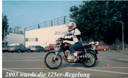
2003 wurde die 125er-Regelung

dass mit der Angleichung an die EU-Stufen-Führerschein-Regelung an die EU (erst 27 PS, dann 34 PS und heute 35 kW) die Versicherungsprämien steigen werden und das Töfffahren für viele Kreise wieder unerschwinglich werden könnte wie Mitte der Siebzigerjahre. Dies ist glücklicherweise nicht eingetroffen, trotz eines anfänglichen Anstiegs in den ersten paar Jahren der Neureglung: Die Zahl der Unfälle zeigt heute, auch bei den Töff-Fahrern, eine ständige Tendenz nach unten, ist aber stark wetterabhängig.