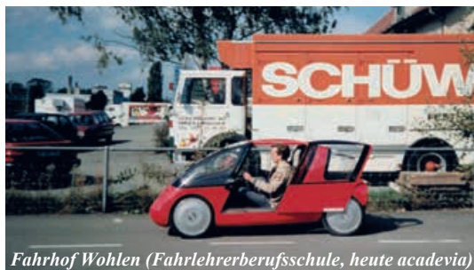
Fahrfhof Wohlen (Fahrlehrerberufsschule, heute acadavia)