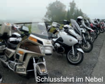
Schlussfahrt im Nebel Frühstücksbuffet