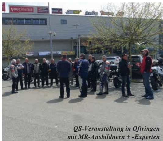
QS-Veranstaltung in Oftringen mit MR-Ausbildnern + -Experten

Auf der Basis des 1. Instruktor-Kurses des Schweiz. Motorrad-Fahrlehrer-Verbandes begab ich mich ab 1992 in die Fahrlehrer-Aus- und Weiterbildung. Während rund 10 Jahren vernachlässigte ich mein Geschäft und war vor allem in der Ostschweiz in der Weiterbildung für Motorrad-Fahrlehrer tätig. Heute bin ich nicht mehr an der Front, sondern helfe in der Qualitätssicherungs-Kommission als Vertreter der Sparte Motorrad die Fahrlehrerausbildung zu prüfen und weiterzuentwickeln. So war ich im letzten Herbst anlässlich von Töff-Fahrlehrer-Prüfungen in Fällanden bei Küde, der als Ausbilder für die ffs tätig ist – so hat sich der Kreis wieder geschlossen.