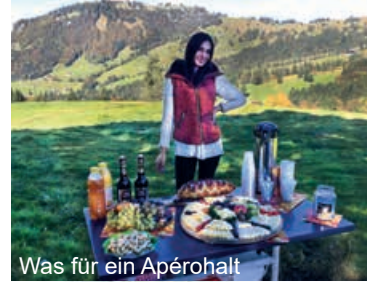
Was für ein Apérohalt