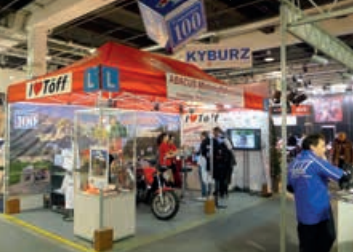
SM 2016: Halle 3, Stand A15