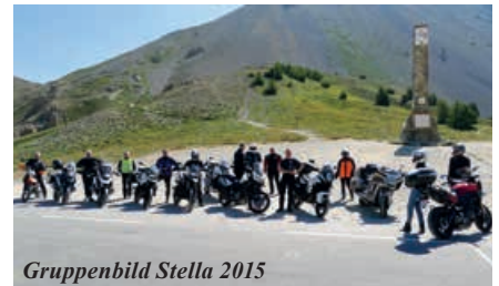
Gruppenbild Stella 2015

Die Stella 2015 und 2016 waren SUPER-Veranstaltungen: 2015 gingen wir einen Kompromiss ein und verzichteten grösstmöglich auf Schotter, 2016 aber war es der Wunsch, wenigstens der meisten, der Teilnehmer. Eine «Testa Assietta» zu fahren ist möglich selbst mit einer 916er-Ducati oder einer GoldWing... Wer aber wirklich Geländespas haben möchte, leistet sich für die Tage in Italien eine Miet-Enduro und ich garantiere für maximalen Fahrspass bei grösstmöglicher Fahrsicherheit!