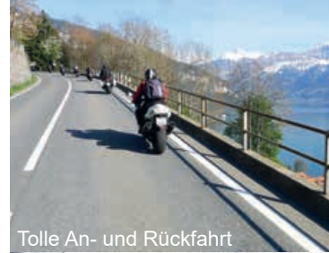
Tolle An- und Rückfahrt