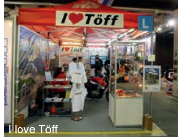
I love Töff