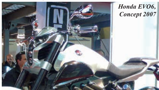
Honda EVO6, Concept 2007