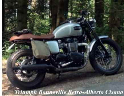
Triumph Bonneville Retro-Alberto Cisano