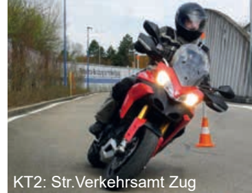
KT2: Str.Verkehrsamt Zug