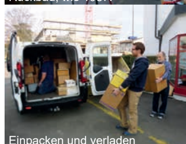
Einpacken und verladen «Alles kaputt» gibt Hunger