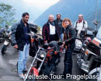
Weiteste Tour: Pragelpass