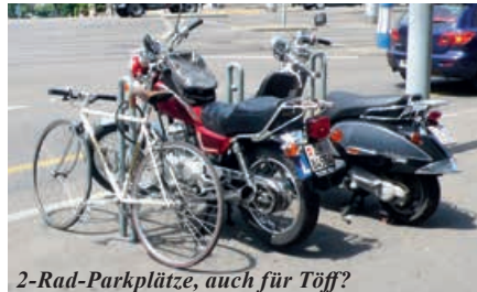
2-Rad-Parkplätze, auch für Töff?

2007 thematisierte ich einmal mehr das faktische Parkierverbot für Motorräder: Seit 1989, als das Trottoirparkier-Verbot für Motorfahrzeuge eingeführt wurde, ist das Parkieren aller Motorräder praktisch verboten: Etwa 1000 offizielle Töff-Parkplätze (oft sind es für Zweiräder, auch nicht-motorisierte) in der Stadt Zürich stehen etwa 30'000 Fahrzeugen gegenüber, die täglich in die Stadt pendeln. Das Rezept, das Gesetz umzuschreiben, dass das Parkieren von Motorwagen auf Trottoirs mit Ausnahme markierter Parkfelder, verboten sei, würde es erlauben, wenigstens da offiziell zu parkieren, wo der Platz für die Passanten in einer Breite von 1,5 m frei bleiben würde. Nun sind 10 weitere Jahre ins Land gegangen und es ist immer noch nichts passiert.