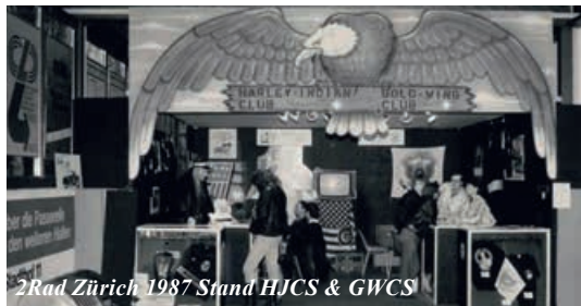
2Rad Zürich 1987 Stand HJCS & GWCS

Am 6. Febr. 1985, einen Tag nach Küde, übernahm ich bei Honda-Keller meine zweite GoldWing, eine vollverkleidete Aspencade, benannt nach einem berühmten Motorrad-Treffen in Colorado. Diese Maschine kam 1984 auf den Markt und sah so aus, wie man sich heute eine GoldWing vorstellt: Bequeme Sitzbank, mit Lehne und Armstützen für den Beifahrer, Gepäckboxen rundum und eine grosse Tourenverkleidung, die es erlaubt, 1000 Kilometer an einem Tag zu absolvieren ohne Ermüdungserscheinungen. Mit dieser Maschine bin ich bis heute 250'000 Kilometer gefahren. Sie war 2 mal auf der Isle of Man, in Amerika legte ich 1986 44'000 km in insgesamt 30 US-Staaten inklusive Kanada zurück. In Australien bewegte ich 2014 eine 1984er-Aspencade über 7'200 km.