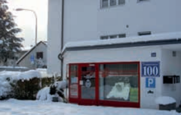
März 2006 Jahrhundert-Schnee

Seit unserem 20jährigen Jubiläum haben wir keinen LOVERIDE ausgelassen: Dieser fällt jeweils auf den ersten Mai-Sonntag, ausgenommen er wäre am 1. Mai, dann kommt der 8. Mai zum Zug. Dieser Anlass mit Benefiz-Charakter wird durch die Harley-Szene ausgeführt, wobei jedermann, ob zu Fuss, mit dem Velo, mit dem Roller oder mit irgendeiner Maschine willkommen ist. Der Rideout ist ein Umzug von 10 mal je 500 Fahrzeugen, die auf einer bestimmten, von vielen Helfern und der Polizei abgesicherten Strecke stattfindet. Der ganze Anlass ist die grösste Töff-Party der Schweiz und bei gutem Wetter kommen gerne mal gegen 10'000 Motorräder auf das riesige Festgelände auf dem Dübendorfer Militärlugplatz.