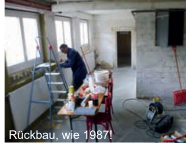
Rückbau, wie 1987!