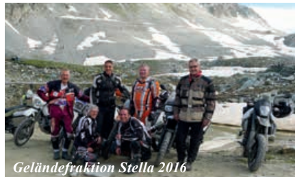
Geländefraktion Stella 2016

Donnerstag, 6. bis Montag, 10. Juli: 5 Tage mit Strassenmaschinen möglich, Enduros können transportiert (auch Mietmaschinen) werden wie auch das Gepäck.